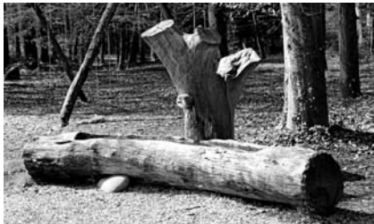
Brunnen beim Waldhaus Gänter