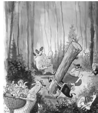
Wir sammeln und pflücken mit Mass