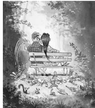
Wir beschädigen und hinterlassen nichts