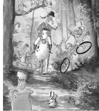
Wir respektieren einander

Den ganzen Wald-Knigge können Sie unter www.waldknigge.ch einsehen und in beliebiger Anzahl bestellen oder herunterladen. Er ist übrigens auch für die Schule geeignet. Mehr Infos zum Wald unter: www.waldschweiz.ch