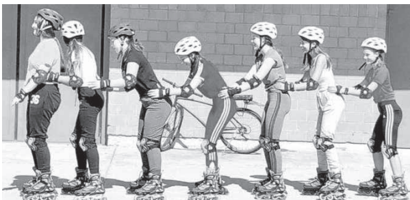
Bild eines Inlinekurses in Tenero von 2018

Nun hoffen wir natürlich auf ein gutes neues Schuljahr mit weiteren Lockerungen. Allerdings wird es wohl noch lange keinen Handschlag mehr geben. Vielleicht nie mehr und er verschwindet aus unserer Kultur, wer weiss. Möglicherweise müssen die Jugendlichen weiterhin Abstand zu den Lehrpersonen halten - und umgekehrt - und wir müssen das Visier weiterhin tragen, was nicht sehr angenehm ist, aber wenn es hilft! Ausserdem sind dann Eltern wieder auf dem Schulgelände zugelassen, was bedeutet, dass es wieder Besuchstage geben wird und Eltern zu Anlässen kommen können. Vielleicht sind dann auch wieder Sportanlässe zugelassen wo man sich anfassen darf, wer weiss?