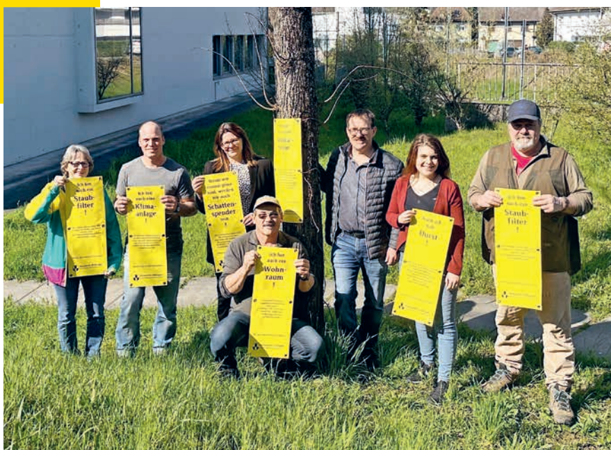
Die LEK mit den vorbereiteten Baumplakaten.

Möchten Sie etwas Gutes für das Klima tun und in Ihrem Garten einen Baum pflanzen? Achten Sie dabei auf einheimische Pflanzen, denn so können Sie Vögel, Schmetterlinge und Wildbienen im eigenen Garten fördern und unterstützen. Sie wissen nicht, welche Bäume und Sträucher Sie pflanzen sollen? «Floretia», der Gratis-Ratgeber für Wildpflanzen, hilft weiter. Er schlägt vor, welche einheimischen Pflanzen im Garten oder dem Vorplatz gepflanzt werden können – basierend auf Lage, Lichtverhältnissen und Feuchtigkeit.