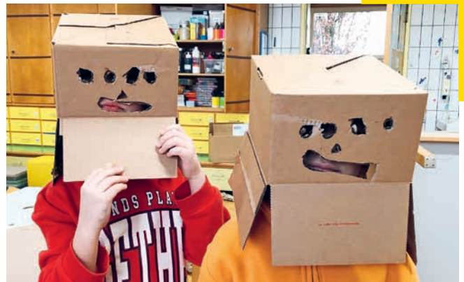
Wer versteckt sich denn da unter den Kartonschachteln?

Waren die Kindergärtnerinnen zu Beginn noch als leitende Personen in diesen Prozessen involviert, rückten sie mit der Zeit mehr und mehr in den Hintergrund und nahmen eine Beobachter- und Begleiterrolle ein. Einige Kinder fanden sehr schnell ins Projekt, andere brauchten etwas mehr Zeit. Jederzeit standen die Lehrpersonen allen unterstützend zur Seite.