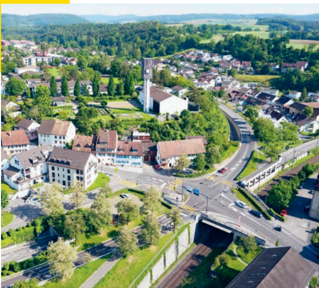
Blick auf die Kreuzung beim Gemeindehaus und die Kirche St. Johannes.