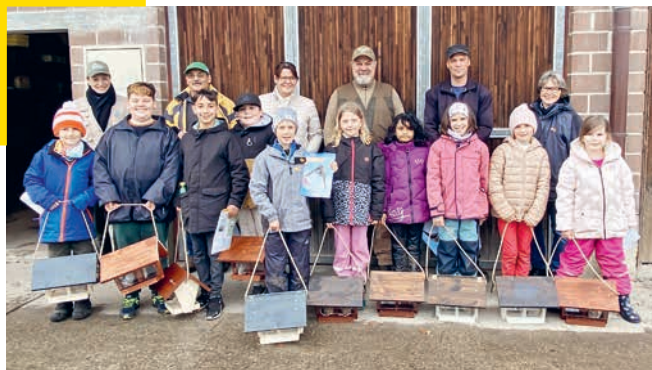
Die Kinder zusammen mit der LEK und den selbst gebauten Vogelhäusern.

Die LEK-Kommission organisierte auch in diesem Jahr einen Kurs rund um das Thema Biodiversität. Während im letzten Jahr noch Wildtierhotels gebaut wurden, drehte sich in diesem Jahr alles um das Thema Vögel. Die Kinder konnten selbstständig aus Bausätzen