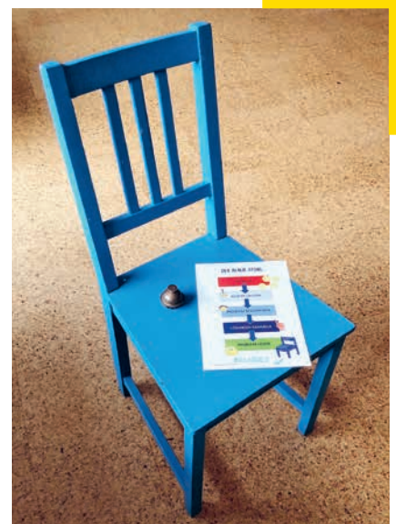
«Der blaue Stuhl»