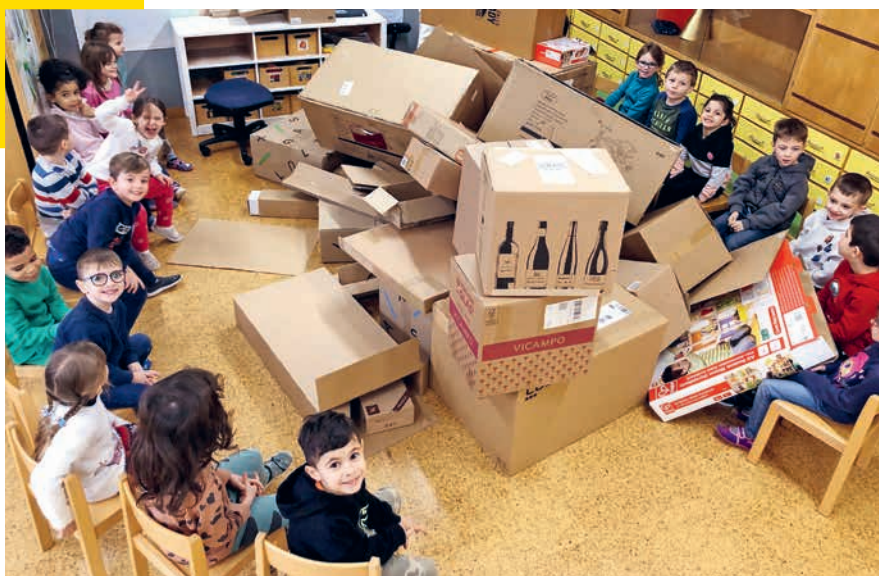
Die vielen Kartonschachteln inmitten der Kindergartenkinder.