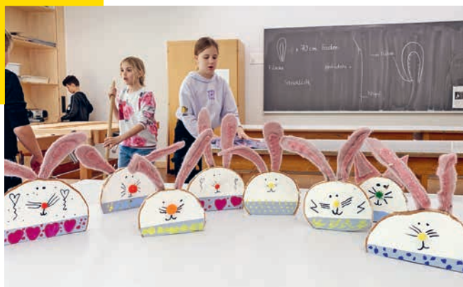
Osterprojekt, die Holzhasen.

Nach vier sehr ruhigen Jahren in Sachen Wechsel im Lehrpersonen-Team zeichnet sich auf Ende dieses Schuljahres eine etwas grössere Rochade ab. Aktuell rechnen wir mit insgesamt sieben Lehrpersonen und einer Heilpädagogin, welche die Schule verlassen werden. In den meisten Fällen handelt es sich um Lehrpersonen mit kleineren Pensen (15 bis 60%). Die Gründe für den Abgang sind vielfältig: Abschluss der Ausbildung, Umzug in einen anderen Kanton, Weltreise, Berufswechsel usw. Bisher sind auf alle ausgeschriebenen Stellen genügend und fachlich ausgezeichnete Bewerbungen eingegangen, sodass wir davon ausgehen dürfen – trotz angespanntem Stellenmarkt – auf den Schuljahresstart im August alle Stellen besetzen zu können.