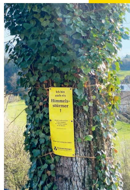
Eines der Baumplakate an seinem neuen Platz.