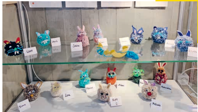
Osterprojekt, die Pomponhasen.

Während der Pomponhase selbstständiges Arbeiten nach Anleitung, Entwerfen eigener Formen, sauberes Ausschneiden und Kleben mit dem Heissleim abverlangte, war der Holzhasen etwas kniffliger. Für die