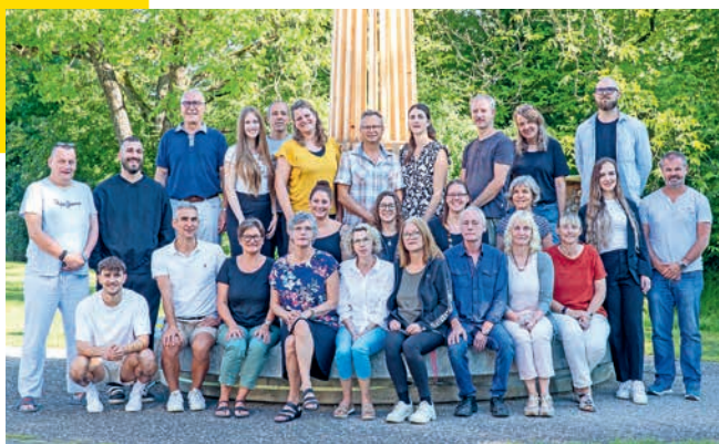
OSUA – Team

O Stobt für Offeheit für alles und jede S Stobt für Stärchi womer bruched im Läbe U Stobt für you wel do gohts om dich A Stobt für alli so verschiede und glich