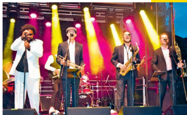
UNIQUE aus Baden sorgte für Stimmung bis zum Festende.