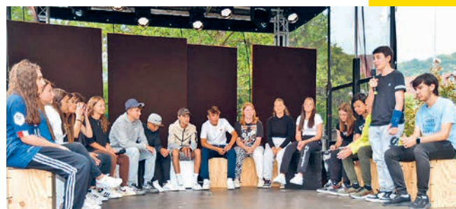
Die Sek 2b führte lustige Theaterszenen vor.